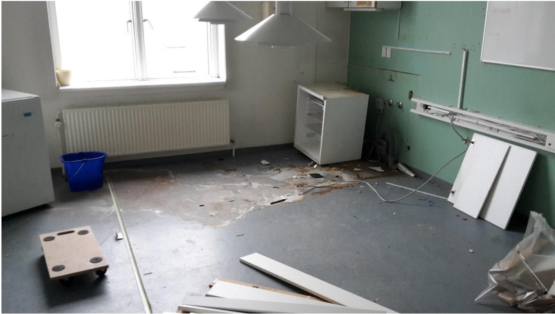
Køkkenet (med plamagen) under transformation