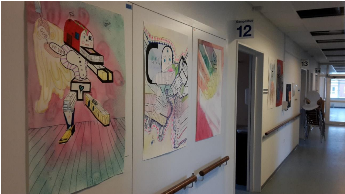
Foruden at være SOSU-hjælper, snedker og arkitekt er R. også maler, og her er et par af hans ting kommet op